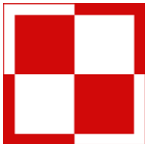
A lengyel légierő felségjele

A felkelés kirobbanásakor Raczkiewicz megbízott emigráns lengyel elnök kérésére Winston Churchill brit miniszterelnök azonnal utasította a Szövetségesek Földközi-tengeri Légierőjének (Mediterranean Allied Air Force – MAAF) parancsnokhelyettesét, egyben a Földközi-tengeri és Közel-keleti brit repülő erők parancsnokát, Sir John C. Slessor repülőmarsallt, hogy a lehetőségekhez képest nyújtson segítséget. Slessor engedélyezte a segélyszállítmányokat Lengyelország felé, azonban a kialakult légihíd teljesítménye korántsem volt egyenletes és kielégítő. A veszteségek emellett riasztó mértéket öltöttek, tehát a bevetések kimondottan kockázatosak voltak.