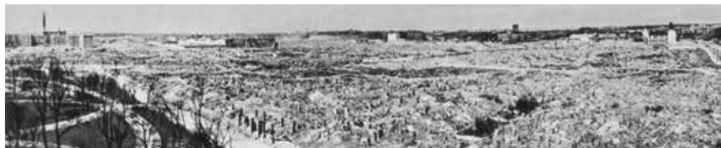
A lerombolt Varsó

A Honi Hadsereg főparancsnoka, Tadeusz Komorowski – fedőnevén „Bór” – 1943. november 20-án elrendelte a „Burza”, azaz Vihar hadművelet megindítását. Ennek során a lengyel alakulatok a korábban németek megszállta területeket foglalták vissza. Taktikai manővereiket lehetőség szerint össze kellett hangolniuk a Vörös Hadsereg csapatmozgásaival. Ugyanakkor a Honi Hadsereg vezetését politikai szándékok is vezérelték, hiszen arra törekedtek, hogy egyértelműen a szovjetek tudomására hozzák, hogy a lengyel nemzettől idegen a kommunista irányvonal. A „Vihar” akció katonailag a németek, politikailag a Szovjetunió és a velük tartó lengyel kommunisták ellen irányult. Ha a támadás kettős célját szem előtt tartva készítünk mérleget, akkor megállapíthatjuk, hogy katonailag győzelemként, politikai értelemben viszont kudarcként értékelhető. A szovjetek a harcok során szívesen vették a lengyel segítséget, azonban a front átvonulása után az NKVD a lengyel alakulatok katonáit lefegyverezte, a tiszteket letartóztatta.