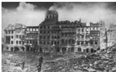
A lerombolt varsói óváros

A felkelés 1944. augusztus 1-jén, 17 órakor tört ki. A Varsóban működő lengyel Honi Hadsereg létszáma megközelítőleg 50 000 főt tett ki. Voltak közöttük nők és férfiak egyaránt, de nem rendelkeztek mindannyian harci tapasztalattal. Fegyverzetük hiányos volt, s utánpótlásuk is akadozott. A hosszú ideje elnyomásban élő lengyelek oly elszántan küzdöttek, hogy még a németeket is meglepték. Azonban maroknyian voltak a német hadigépezethez képest, s végül a fizikai győzelem utóbbiak javára dőlt el.