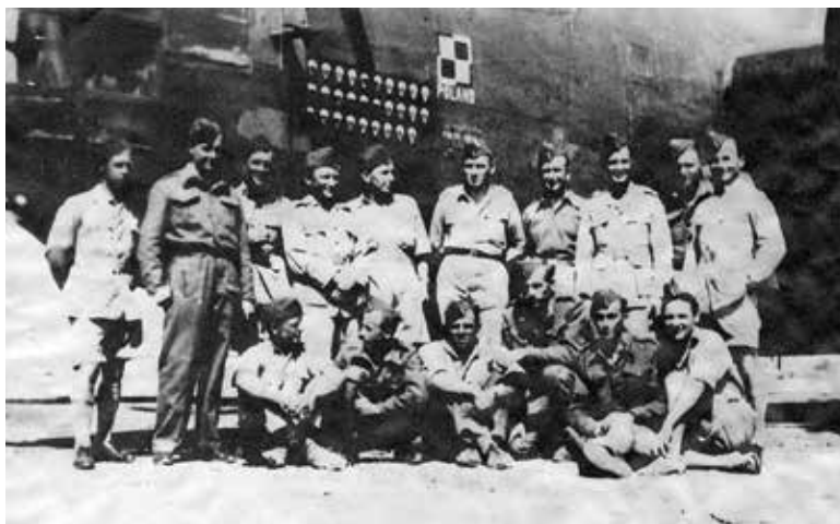
Lengyel repülős alakulat a lengyel légielő felségjelével

1944 augusztusában az MAAF 170 repülőgépet irányított Lengyelország felé. A küldetésben az 1586-osok 19 éjszaka 83 géppel vettek részt. A 170 repülőgépből 78 (ebből 24 lengyel) közvetlenül Varsó fölött, 60 gép (ebből 45 lengyel) Varsó közvetlen közelében (főként a Kampinos-i és Kabacki erdőkben), 32 gép (ebből 14 lengyel) más területek fölött dobta le terhét, 59 repülőgép (ebből 27 lengyel) nem tudta teljesíteni feladatát. Augusztusban összesen tehát 111 repülőgépnek sikerült ledobnia a szállítmányát, ez 65 %-os teljesítmény, ezt a statisztikai adatot azonban a kényszeroldások, valamint a téves vetések hozzávetőlegesen 60%-osra rontották le. A ledobások valós hatékonysága tehát a kezdetektől fogva nagyon alacsony volt, így a közvetlenül Varsó fölé irányított 78 gép összesen 52 tonnányi ellátmányt dobott le, amiből mindössze csak 30-35 tonnányi jutott el végül magukhoz a felkelőkhöz. A statisztikát tovább rontja az a tény, hogy Varsó ellátásához hozzávetőlegesen napi 500 tonna ellátmányra lett volna szükség! Később ez az arány a németek előnyomulásával és a gyűrű egyre szorosabbá válásával, sőt az egyes felkelő körzetek szétszakításával még tovább romlott.