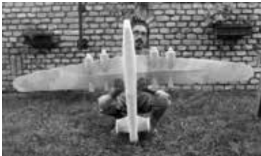
A készülő repülőgépforma