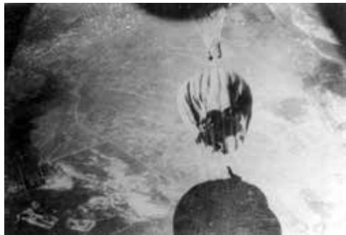
Az utánpótlást a repülők ejtőernyők segítségével dobták le a felkelők számára