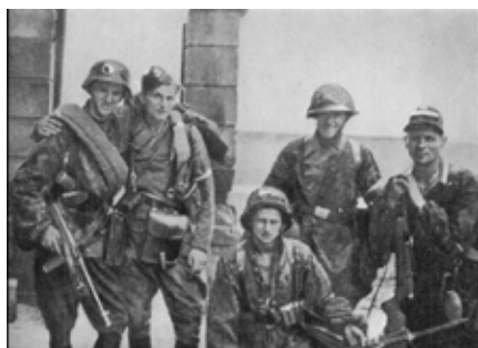
A varsói felkelők – férfiak, nők különféle korú emberek fogtak fegyvert a megszállók ellen

A felkelés 1944. augusztus 1-jén, 17 órakor tört ki. A Varsóban működő lengyel Honi Hadsereg létszáma megközelítőleg 50 000 főt tett ki. Voltak közöttük nők és férfiak egyaránt, de nem rendelkeztek mindannyian harci tapasztalattal. Fegyverzetük hiányos volt, s utánpótlásuk is akadozott. A hosszú ideje elnyomásban élő lengyelek oly elszántan küzdöttek, hogy még a németeket is meglepték. Azonban maroknyian voltak a német hadigépezethez képest, s végül a fizikai győzelem utóbbiak javára dőlt el.