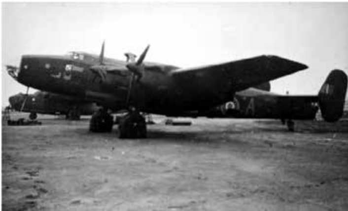
Egy angol Halifax – ilyennel repültek a Ruzsán szerencsétlenül járt lengyel pilóták

A visszaúton a gép és személyzetének sorsa megpecsételődött Ruzsa (1944-ben Szeged – Csorva járás) fölött. A fellelhető dokumentumok és a szemtanúk beszámolóí alapján a repülőgépet szeptember 11-én hajnali 03.00 h körül egy német éjszakai vadászgép üldözőbe vette és lelőtte. A lelővést Wilhelm Jochnen főhadnagynak (8./NJG 6) igazolták.